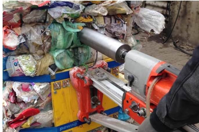
Abbildung 6: Betonkernbohrer als Konzeptprototyp für die Direkte Ballenbeprobung.

Ein Konzeptprototyp wurde entwickelt. Ausgehend von einem handelsüblichen Betonkernbohrgerät bestand dieser aus Bohrmotor, Bohrschaft mit Zackenkrone, Stativ, Montageplatte und zwei Zurrgurten (siehe Abbildung 6). So wurde eine neue Beprobungsmethode entwickelt, die im Weiteren als „ Direkte Ballenbeprobung “ bezeichnet wird.