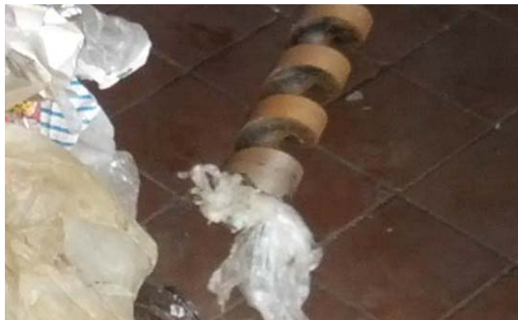
Abbildung 2: Beprobungsmethode mit Spiralbohrer