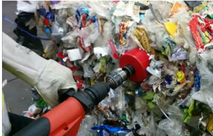
Abbildung 1: Beprobungsmethode mit Bohrer mit Sägezahnkrone und Zentrierbohrer