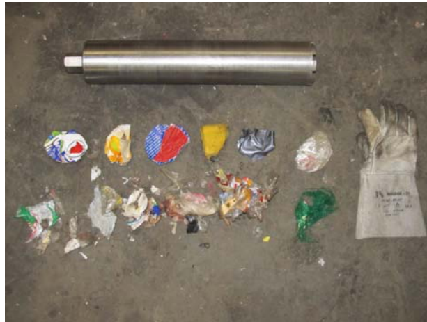
Abbildung 7: Bohrklein einer Einzelprobe mit Bohrschaft als Ergebnis der Direkten Ballenbeprobung

Die gewählten Abmessungen des Bohrschaftes betragen 100 mm Durchmesser und 500 mm Länge. Damit konnten 0,5-2 kg Bohrklein als Einzelprobe gewonnen werden, das einerseits durch heftiges Schlagen auf ein Holzbrett herausgeklopft und andererseits manuell aus dem Schaft herausgezogen werden musste (siehe Abbildung 7). Bei geringeren Durchmessern war das Entnehmen der Probe schwieriger und dauerte länger. Außerdem war das Gewicht der Einzelprobe geringer (siehe Tabelle 2), wodurch für die gewünschte Gesamtprobenmenge von 20-30 kg mehr Bohrungen benötigt wurden. Kürzere Schaftlängen ergaben ebenfalls weniger Einzelprobenvolumen. Längere Bohrschafte sind bei den üblichen Schneidstärken von 2 mm aus Stabilitätsgründen nicht verfügbar. Verlängerungen mit Vollmetallstäben sind möglich, die Anwendung ist aber bei Kunststoffballen nicht möglich, weil durch die Elastizität des Materials das Bohrloch beim Herausziehen des Bohrschaftes zum ersten Entleeren teilweise wieder zugeht und nach dem Anbringen der Verlängerung die Stativhöhe nicht ausreicht Bohrschaft und Verlängerung neu anzusetzen.