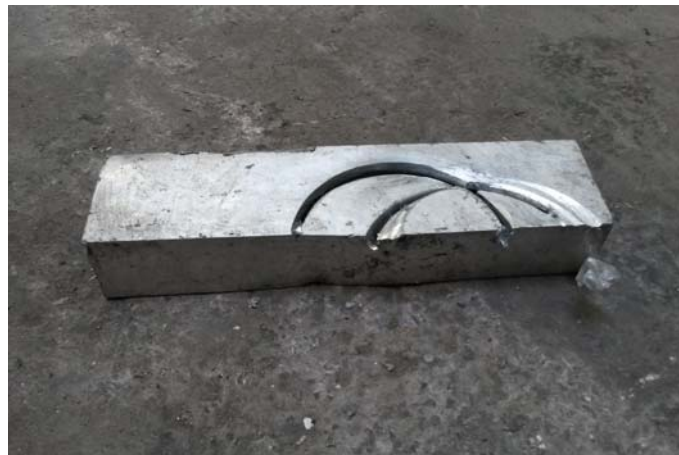
Abbildung 5: Mittels Betonkernbohrer zweimal angebohrtes Aluprofil als massiver Störstoff in einem Mischkunststoffballen.

Unter den getesteten Beprobungsmethoden hat sich das Bohren mit einem Betonkernbohrer als beste Lösung erwiesen. Der Schaft mit Sägezahnkrone war nur in kurzen Längen verfügbar, sodass das Probenvolumen zu gering war. Außerdem hätte die Verschleißfestigkeit der Sägezahnsschneide den im Verlauf der nachfolgenden Versuche gefundenen harten Störstoffen nicht standgehalten (siehe Abbildung 5). Mit dem Spiralbohrer konnte keine Probe gewonnen werden, da praktisch kein Bohrklein entstand, weil das Material aus dem Gefüge nicht abgetrennt werden konnte. Die Kettensäge produzierte wenig Bohrklein, weil das Material nur unvollständig aus dem Ballen herausgelöst werden konnte. Außerdem war die Bedienung kraftaufwendig.