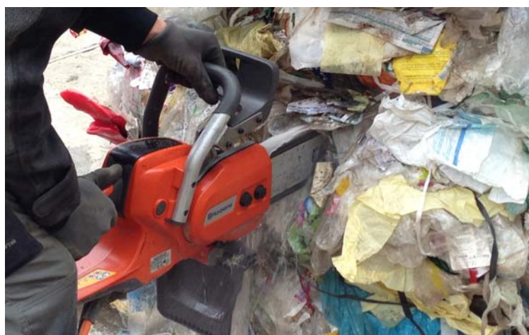
Abbildung 3: Beprobungsmethode mit Kettensäge